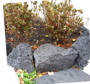
石積み 阿蘇溶岩石