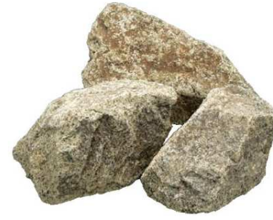
階段蹴上げ 石積み ワズロック・コウガ 花崗岩