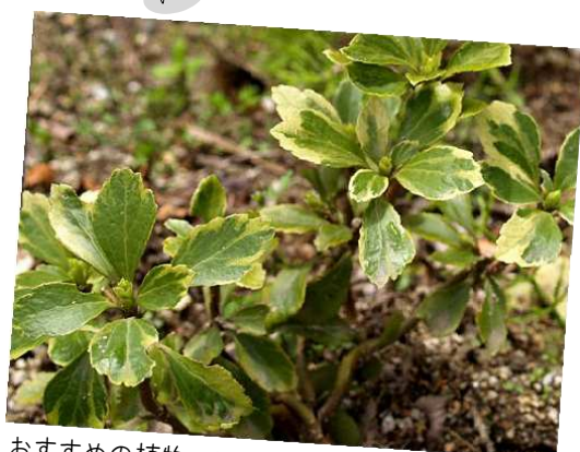
おすすめの植物 フッキソウ(フイリ)

常緑でいつも緑のフッキソウ。特に斑入りの葉は緑の中にアクセントになり、見栄えがします。あまり大きくならず、特に手入れも必要ありません。