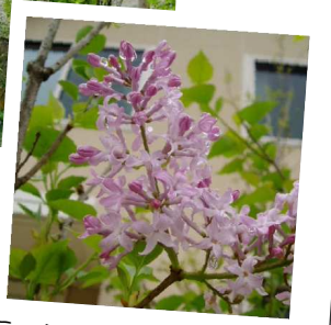
おすすめの植物 ライラック

夏でも涼しい阿蘇の環境に向いているライラック。春に咲くうす紫色の花からは、甘い香りがします。