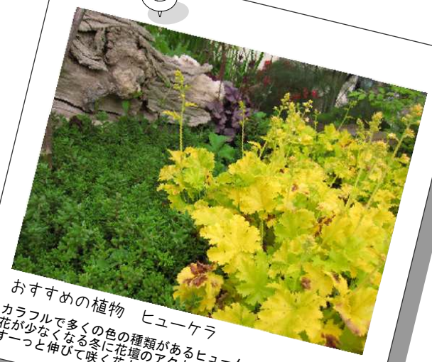
おすすめの植物 ヒューケラ

ロックガーデンといえばセダム。自然界でも岩場に自生しているので、とても自然な景色になります。暑さにも寒さにも強く、周りの植物の引き立て役にもなってくれます。