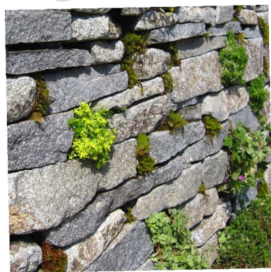
おすすめの植物 セダム

常緑でいつも緑のフッキソウ。特に斑入りの葉は緑の中にアクセントになり、見栄えがします。あまり大きくならず、特に手入れも必要ありません。