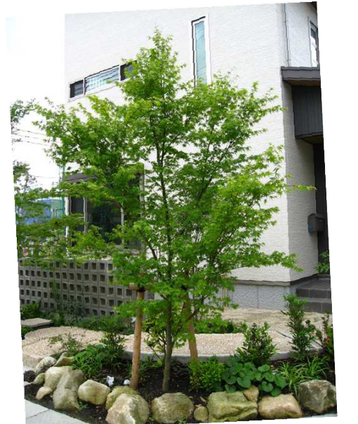
おすすめの植物 イロハモミジ

夏でも涼しい阿蘇の環境に向いているライラック。春に咲くうす紫色の花からは、甘い香りがします。