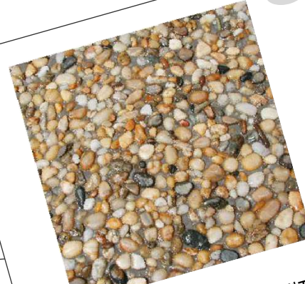
アプローチ舗装 砂利洗い出し仕上げ(金剛石)