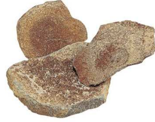
アプローチ舗装 自然石乱形貼り ワズストーン・タンバ(安山岩)