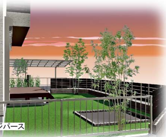
庭イメージパース