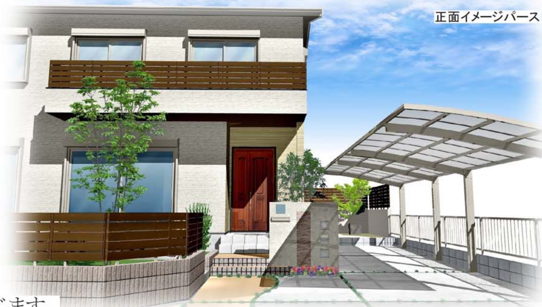
正面イメージパース