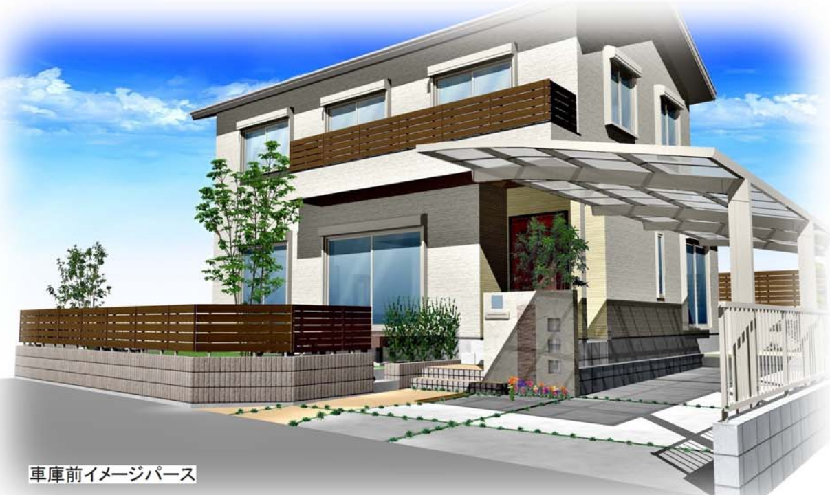
車庫前イメージパース

※土間コンクリート等のレベルは現場調整と致します。 ※本原稿に記載された内容を無断流用または複製・コピーすることを禁じます。 なお全ての著作権はDプラザ鹿児島隼人店に帰属します。